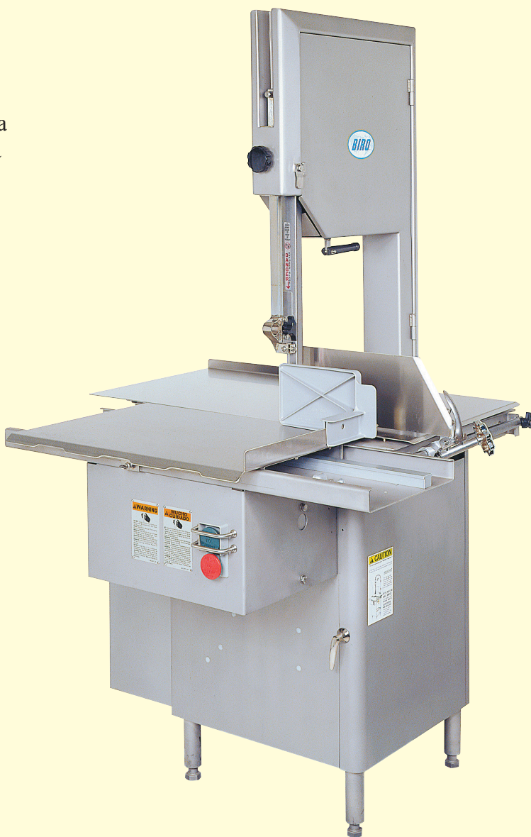
Modelo: 3334SS-4003FH (Estructura de cabeza fija) Configuración estándar

El modelo de Sierra Biro 3334SS-4003FH de cabeza fija para carne y pescado tiene todo lo que tu necesitas para obtener un alto volumen de producción por menos cortes. Su rígida cabeza de acero inoxidable provee una alta velocidad en sus navajas dando como resultado una operación libre de vibración. Esto permite usar una cuchilla estrecha con un número bajo de dientes, lo que le ayuda a minimizar la fatiga del operador así como los residuos del producto, maximizando con ello la productividad y beneficios. Como todas las Sierras Biro, el modelo 3334SS-4003FH tiene una cabeza construida en acero inoxidable y un sistema de manejo de rodamientos de rodillos, un diseño que ha demostrado con los años que es más durable y con menor mantenimiento. Su sierra tendrá una larga vida en el rodamiento a las mayores velocidades, y fácilmente resistirá el uso pesado típico de plantas de carne y pescado. También ofrecemos opciones atractivas como una bandeja de división para cambios de navajas, ruedas de eje doble y una rueda inferior extraíble. El modelo de Sierra Biro 3334SS-4003FH es conocido por su fiabilidad desde 1921.